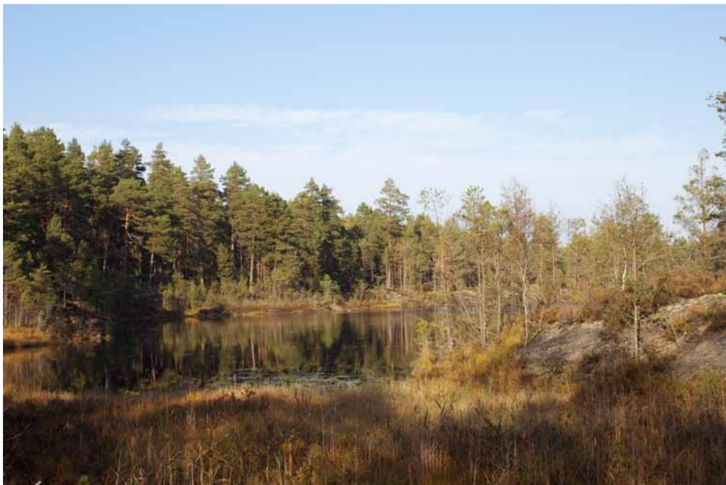
Utsikt over Krokvannet, en del av naturreservatet.

Hvorvidt man skal verne eller ei, ble mye diskutert da vi ruslet gjennom området, ettersom man ved vern av et område ikke lenger kan drive med tømmerdrift – noensinne. Denne retten fraskriver grunneieren seg, men han beholder både grunneierretten og jaktretten på området. Ettersom området som tidligere nevnt ble frivillig vernet, var mange av studentene interessert i hvorfor en skogbruker ville verne et område med produktiv skog. Til svar fikk vi at området var vanskelig å komme til, og dermed ville føre til store kostnader i forhold til verdien av virket som kunne