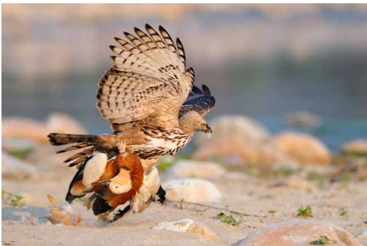
Vekselskogørn (Nisaetus cirrhatus) med rustand (Tadorna ferruginea) i klørne

När vi kör ut ur porten och ser folket i de andra bilarna sitter och stirrar på oss då dem inte fått se någon tiger denna morgon, så är det med ett stort smil som vi kör hem igen med detta oförlömligt randiga möte i minnet.