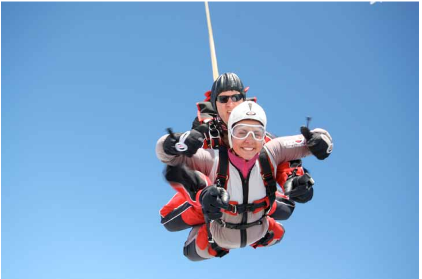
Skydiving i Queenstown

Sommerferien min ble kort, da skolen begynte allerede 8.juli. Årstidene er motsatt, så jeg kom fra vår til vinter. Den første måneden gikk med til å bli kjent med nye folk og sette meg inn i skolesystemet. Det var pangstart fra første stund med mye nytt og masse sosialt. Jeg ville se