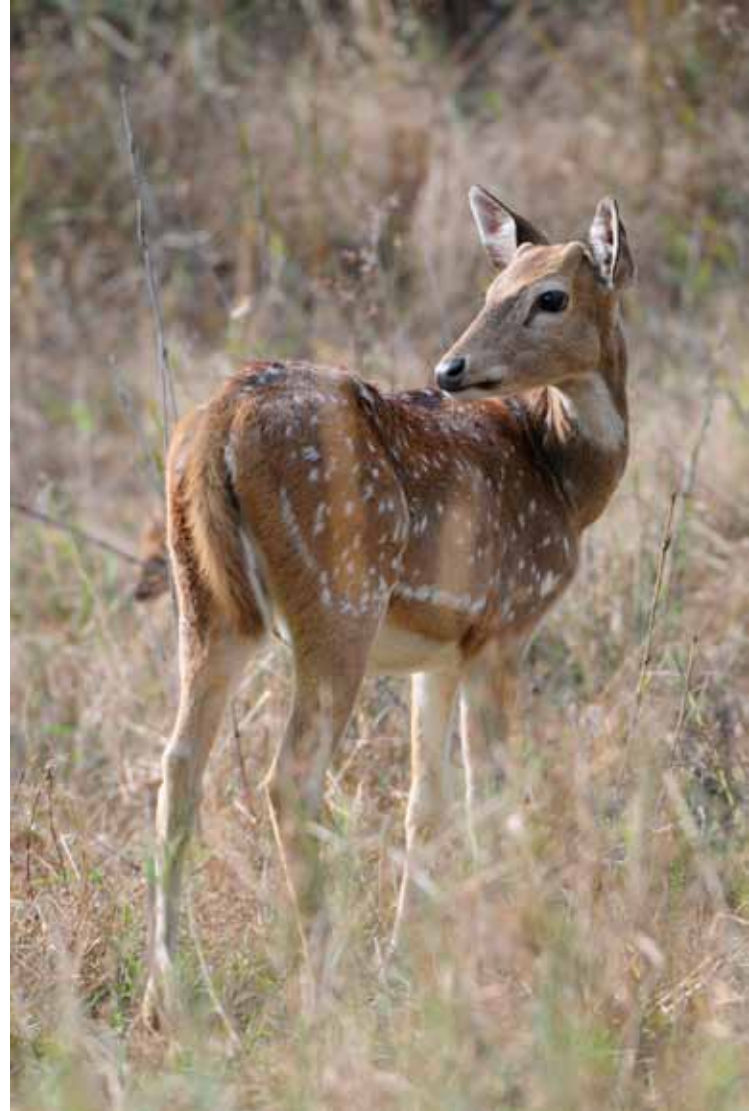
Aksishjort (Axis axis)

Att få se en samlad tigerfamilj hör inte till vanligheterna, att få en tigerunge på tio månader innanför närgränsen på tel-zoomen är ännu ovanligare, men det slutar inte här. Denna hane bestämde sig för att klättra upp i ett träd och detta är så ovanligt att till och med föraren och guiden blev helt till sig. Vi fick totalt cirka 30 minuter tillsammans med familjen innan de vandrade iväg in i djungeln igen. När den större delen av adrenalinet efter detta möte lagt sig så var det dags att köra mot portarna igen.