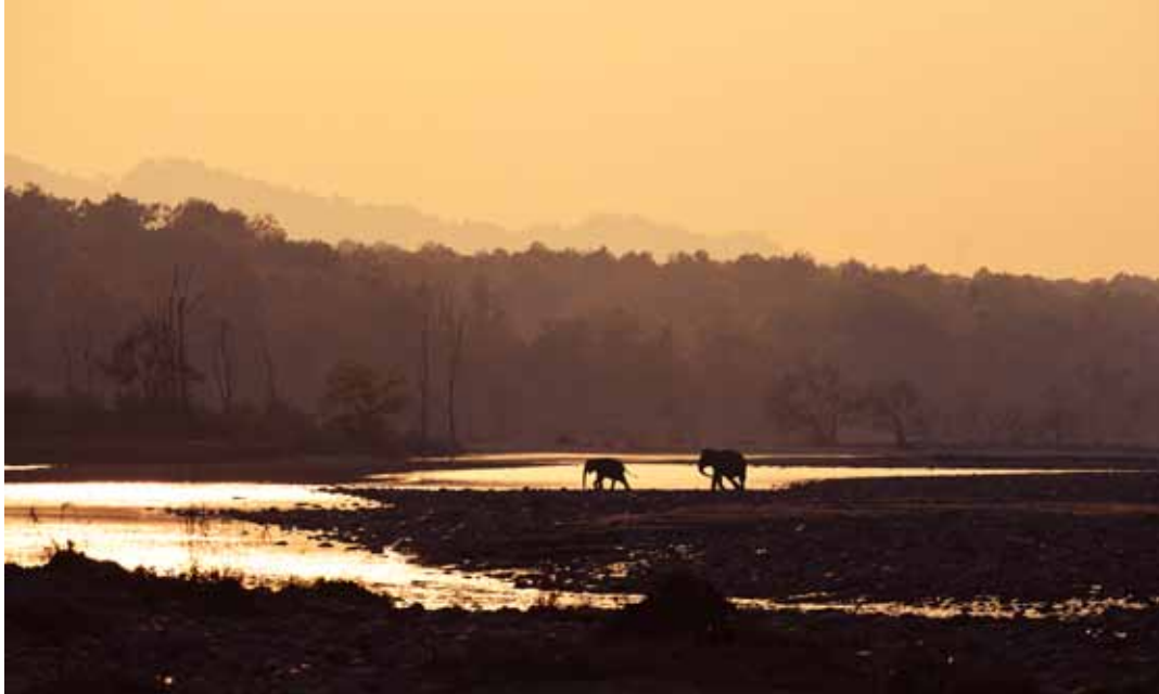
Asiatisk elefant (Elephas maximus)

På vägen ut tänker jag över tigerns status i världen. Det finns cirka 3500 individer kvar varav 1400 finns i Indien. Av tigerns habitat räknar man med att endast elva procent återstår, och detta minskar på grund av ett allt större behov för jordbruk. Arbetet med att rädda tigern har ökat de sista åren, men det är en svår kamp mot tjuvjägare och korrupktion inom myndigheter och nationalparker.