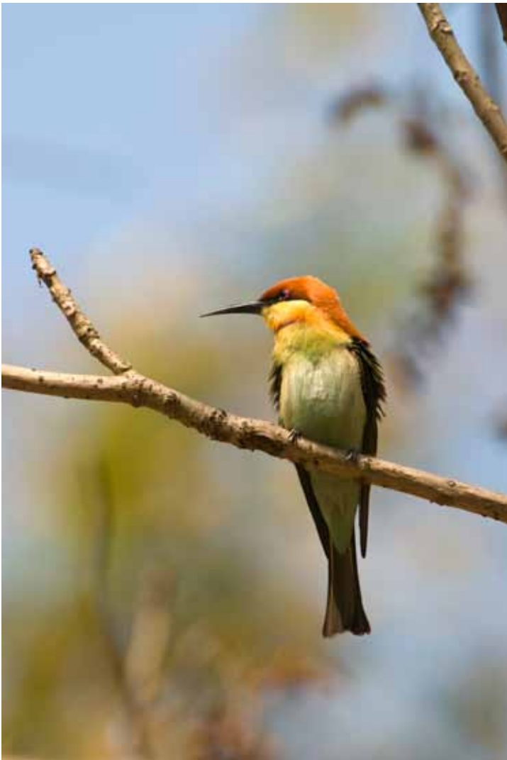
Bengalbieter (Merops leschenaulti)

Vi stannade till för några Axishjortar som slogs i de första solstrålarna. Efter en del övervägande mellan föraren och guiden bestämde dem att vi skulle fortsätta in i parken upp på en höjd där vi inte varit tidigare. Efter en halvtimmes körning med branta stigningar och skarpa kurvor stannar vi till. Längre fram på vägen ligger det fyra tigrar. En mor och tre ungar, två hanar och en hona. Vanligtvis går de på en gång men nu valde mamman att ligga kvar på vägen. Med moderns trygghet i ryggen tog nyfikenheten hos den ena hannen över. Vi verkade vara några spännande objekt så han kom emot oss.